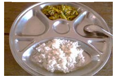
かぼちやの炒め物 (炒め物は、主に朝・昼食)

※「食卓の貯金箱」の募金は、タイ「ひよこホーム」では食費(1日一人あたり75円)の補助(約4割相当)として使われています。