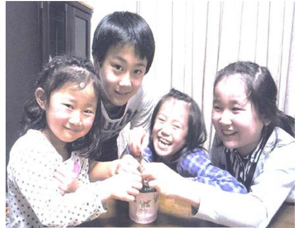
協力いただいているお孫さんたち

小さい芽が少しずつ育ってくれる事を願いなが ら、細く長く続けられたらと思っております。