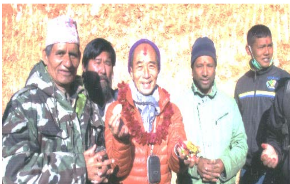
鍬入れ式のお供え物いただきます（中央OKバジ）