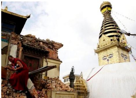
世界遺産スワヤンブナト寺院の建物損壊

とりわけ、約8000年前までは湖で、地盤が軟弱なカトマンズ盆地地域の被害は大きく、地域内の住民の住居のみならず、世界遺産に登録された貴重な歴史的建造物の崩壊、損壊も報告されています。